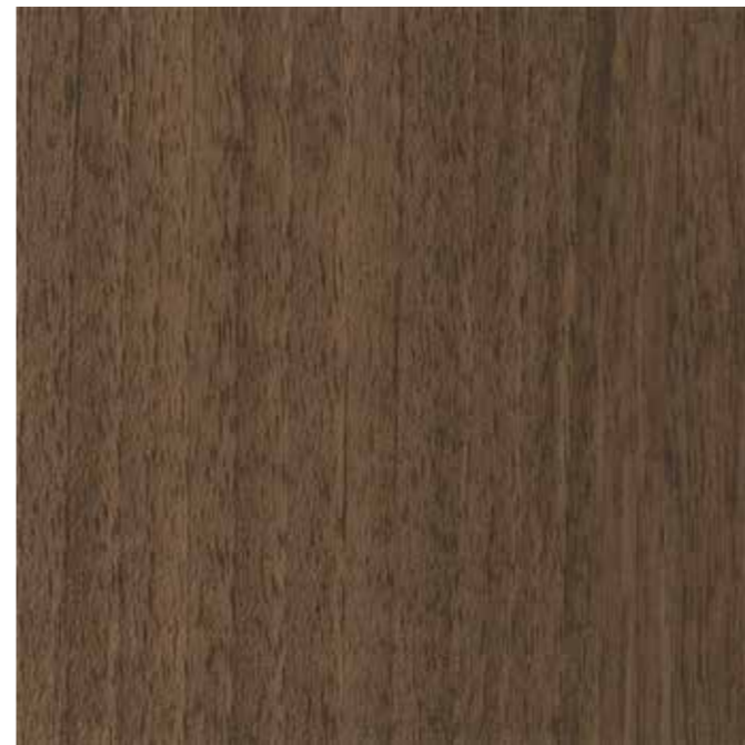
EWV-016 SHモカウォール 外装