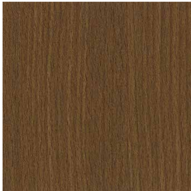
EWV-003 ミディアムチーク 外装