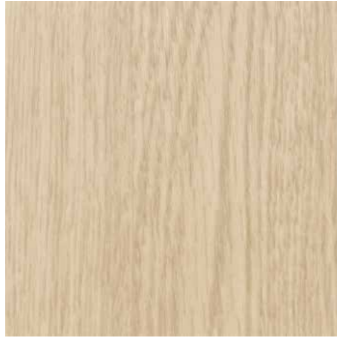
EWV-028 グレイスオークE 外装