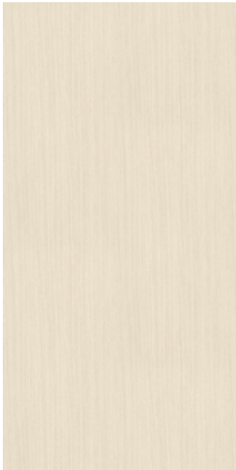
I WV-022 サブリナオーク