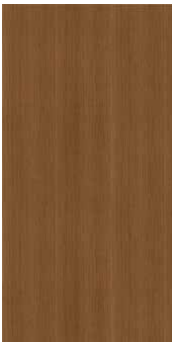
I WV-026 ブラウンナッツ