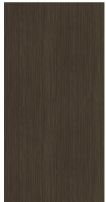
I WV-027 ブラックウッドCC