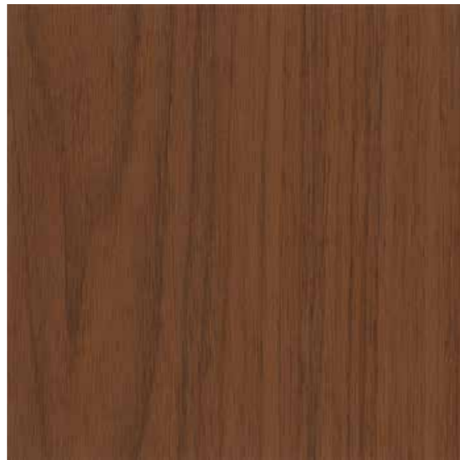
EWV-005 パッソウォールMB 外装