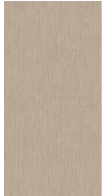
I WV-024 モルトオーク