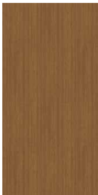
EWV-003 ミディアムチーク