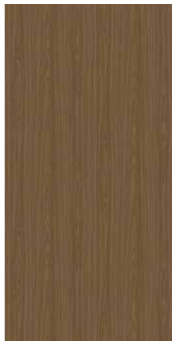
I WV-025 ノマドウォール