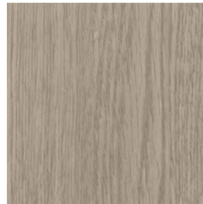
IWV-024 モルトオーク 内装