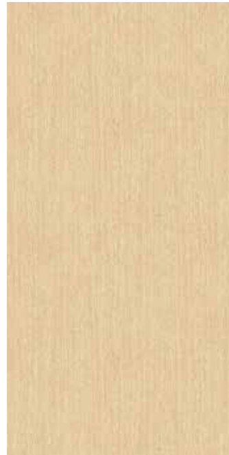
I WV-023 グレイスオークI