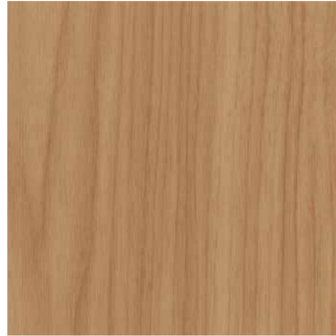
EWV-006 パッソウォールLB 外装