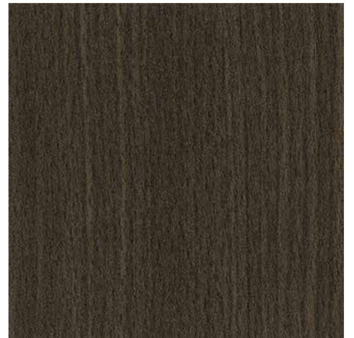
EWV-004 ダークチーク 外装