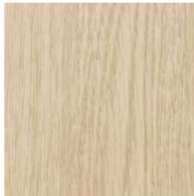
IWV-023 グレイスオークI 内装