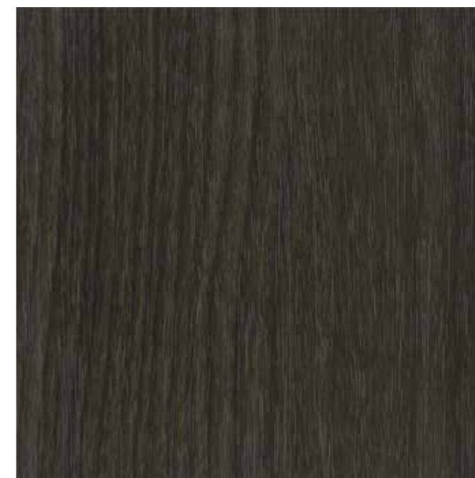
IWV-027 ブラックウッドCC 内装