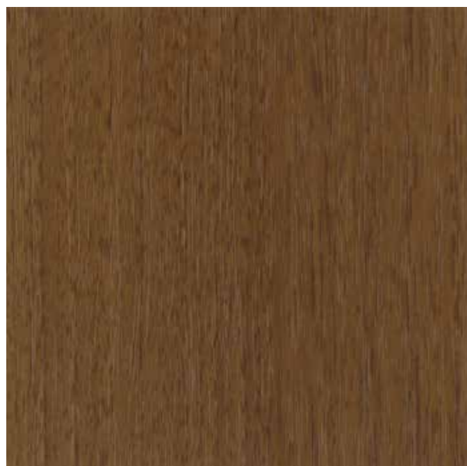
IWV-026 ブラウンナッツ 内装