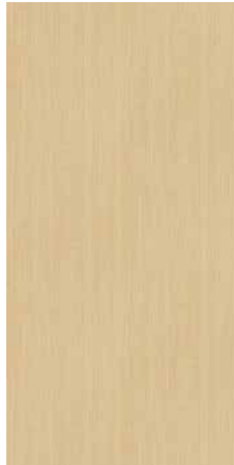
I WV-008 センティアメープル