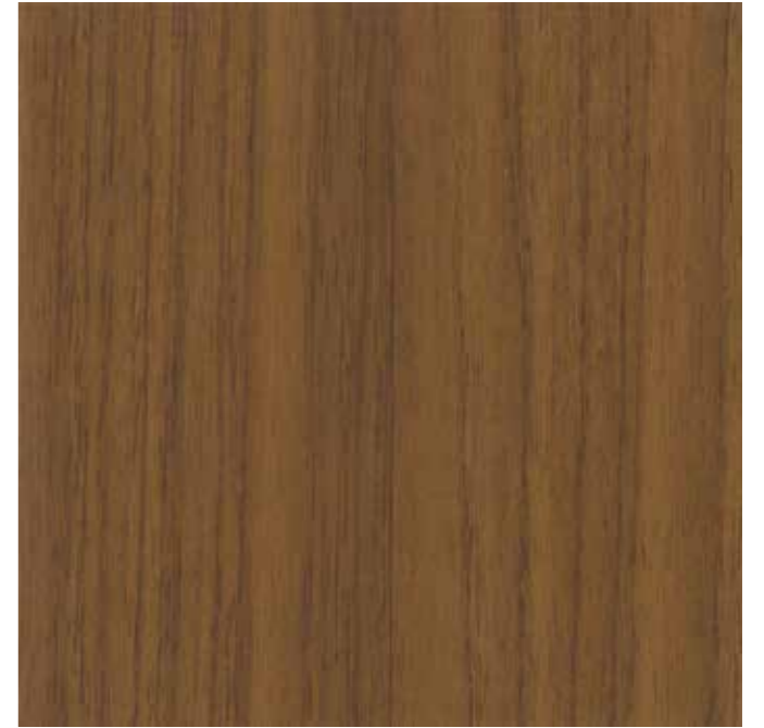
EWV-021 ロココチーク 外装