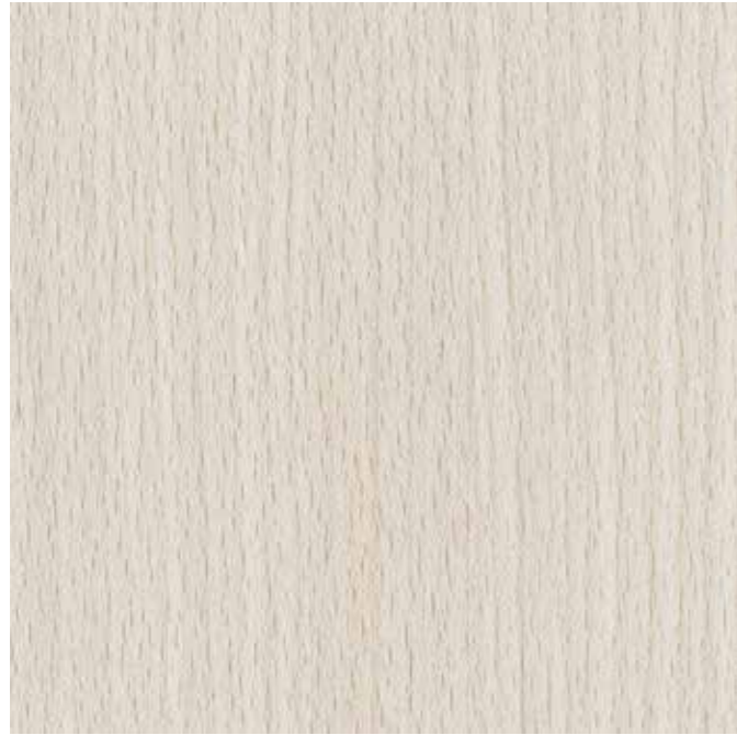
EWV-002 ライトチーク 外装