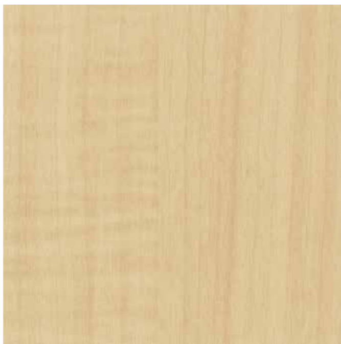
IWV-008 センティアメープル 内装