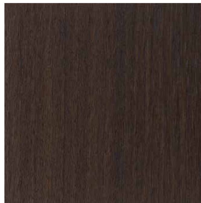
IWV-007 イタリアンウッドNB 内装