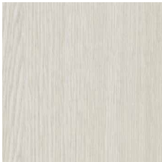
IWV-022 サブリナオーク 内装