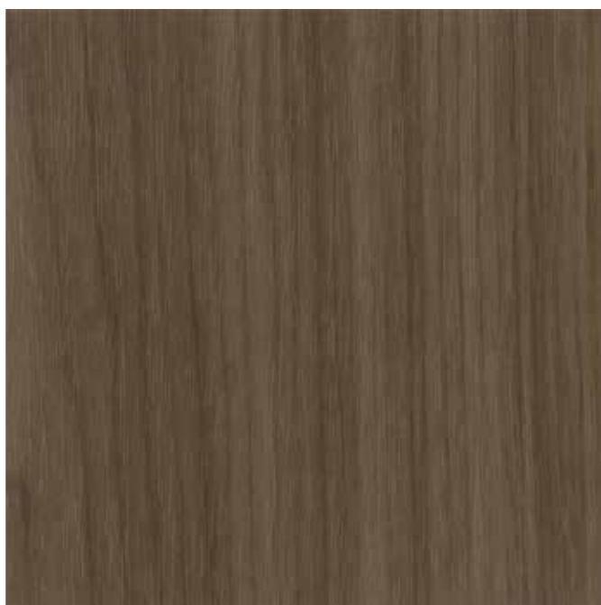
IWV-025 ノマドウォール 内装