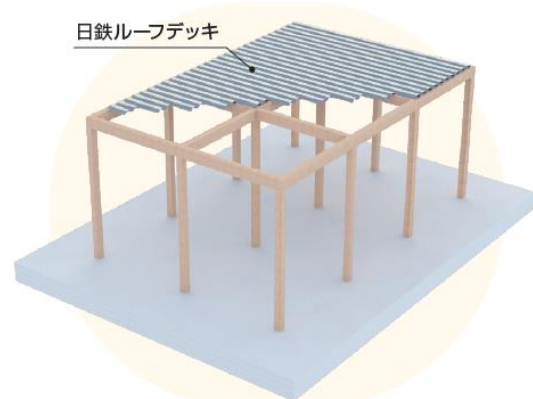
木造 NBR 工法